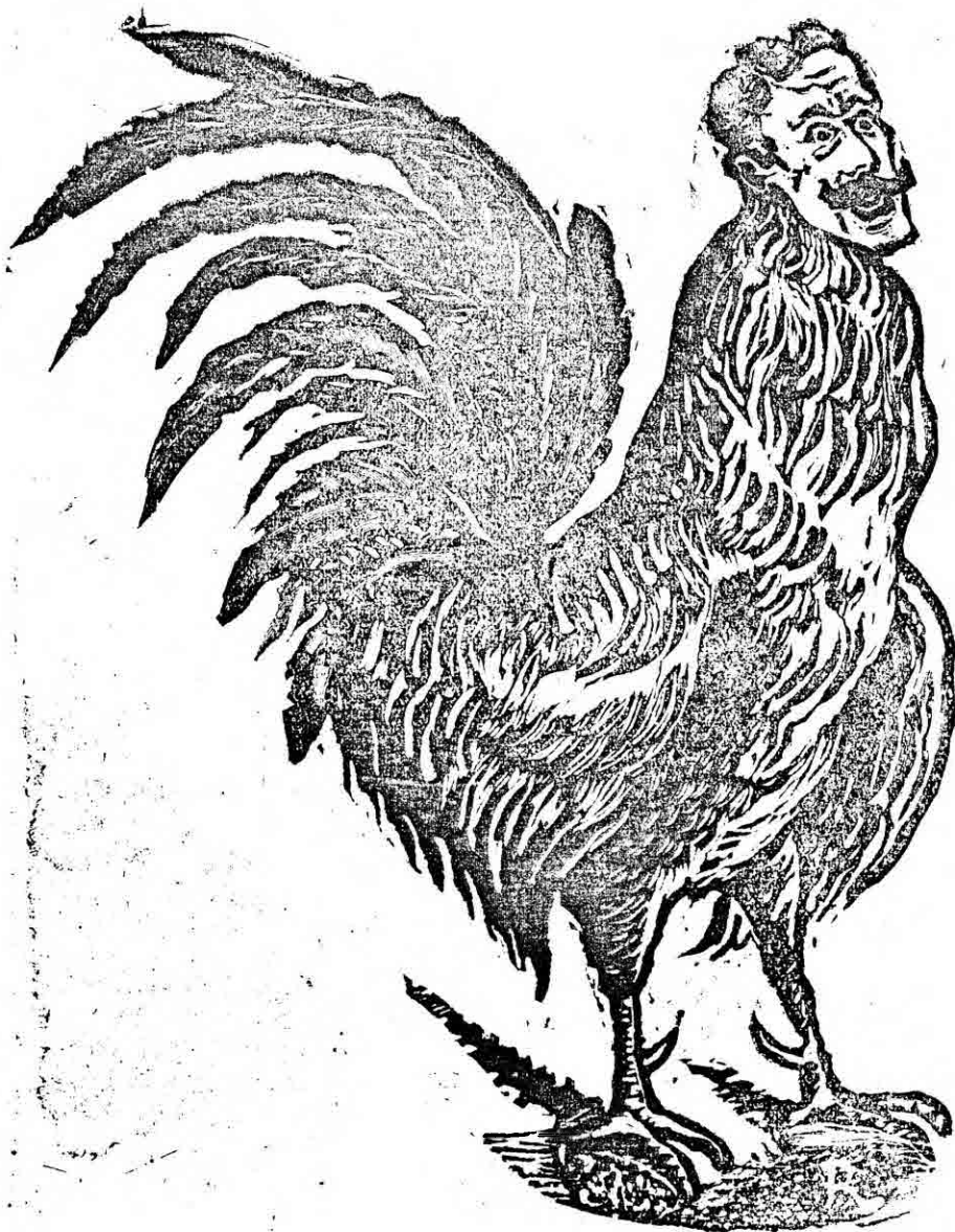
Este GALLO que no canta algo tiene en la garganta